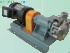
CB 型 Direct-coupling cascade pump