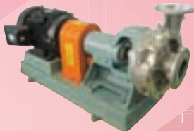
FX 型 Centrifugal pump