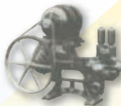
アイスクャンデーブームに対応した 冷凍機用横ピストン式ポンプ

Horizontal piston pump designed for use in freezers to accommodate the popsicle fad