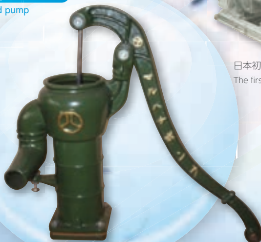
鉄道省の時代に全国の駅で利用された手押しポンプ

A hand pump used at stations all across Japan back in the days of the Ministry of Railways