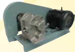
V ベルト駆動型ギヤポンプ V-belt-driven gear pump