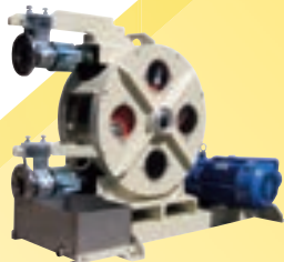
チューブポンプ Tube pump