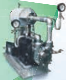
マイクロバブル発生装置 Micro-bubble generator