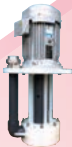
スラリー液に対応したポリプロピレン製渦巻ポンプ Polypropylene centrifugal pump designed for use with slurry