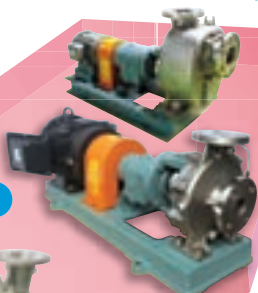
MAP 型渦巻ポンプ MAP centrifugal pump