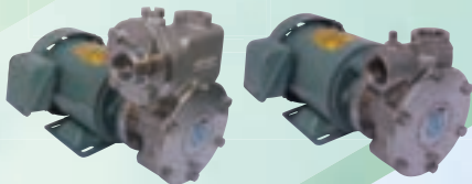
カスケードモーターポンプ Cascade motor pump