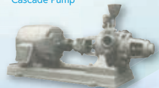
1.25 インチ 2 段カスケードポンプ 2-stage 1.25-in. Cascade Pump