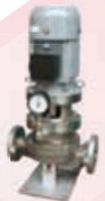
ステンレス製ラインポンプ Stainless steel line pump